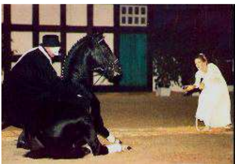
Kostolany im Phantom der Oper

Nativ - Decktaxe: EUR 1.700,- incl. MwSt.